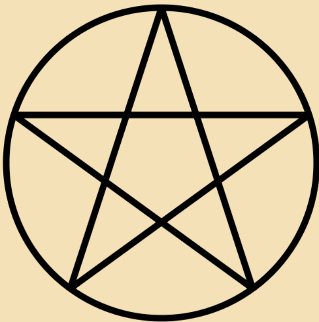
Gwiazda Pitagorejska (Pentagram)

Pentagram, inaczej gwiazda pitagorejska to umiłowany symbol pitagorejczyków. Służył im do pozdrawiania i rozpoznawania siebie nawzajem, kreśląc go na piasku. Pitagorejscy mistycy uważali ją za doskonałość, kojarzona była ze zdrowiem i życiem. Dla pierwszych chrześcijan pentagram odzwierciedlał pięć ran Jezusa ze względu na 5 wierzchołków. Natomiast od XIV wieku uważany za znak szatana, ze względu na podobieństwo do głowy kozła (odwrócony dwoma wierzchołkami do góry). Obecnie w wielu kulturach uznawany jest za symbol magiczny.